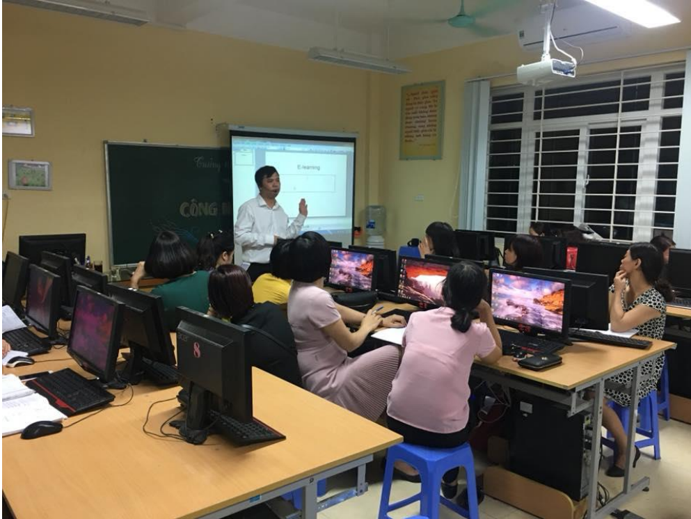
Những hình ảnh của buổi tập huấn:

Buổi tập huấn CNTT của trường đã góp phần nâng cao năng lực của đội ngũ giáo viên trong việc sử dụng CNTT. Bên cạnh đó khuyến khích giáo viên tích cực vận dụng công nghệ thông tin vào giảng dạy và đổi mới hình thức tổ chức, phương pháp và kiểm tra, đánh giá kết quả giáo dục, dạy học của nhà trường, mỗi buổi tập huấn còn có tác dụng tăng cường khả năng tự học, tự nghiên cứu, phát triển... của giáo viên.